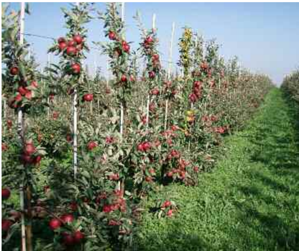
Pollineringsrad i form av prydnadsäppleträd i raderna är oftast mer effektiva som pollinering än träd av en pollineringsort i en annan rad bredvid.

Blommornas storlek och kvalitet – dvs. när blomanlagen sattes och hur lång tid de haft att utvecklas i – har betydelse för fruktens kvalitet. Särskilt i jordgubbar är detta en viktig faktor för bärens storlek. Även frostska-dor under höst, vinter och vårvinter påverkar frukternas storlek och form.