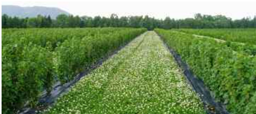
Blommor i gångarna kan konkurrera med grödan.

Klipp gräsgångarna mellan raderna inför blomningen så att inte maskrosor, tusenskönor, vitklöver o. dyl. konkurrerar med grödan om pollinatörerna. Klipp gräset så tidigt på morgonen att pollinatörerna ännu inte hunnit flyga ut.