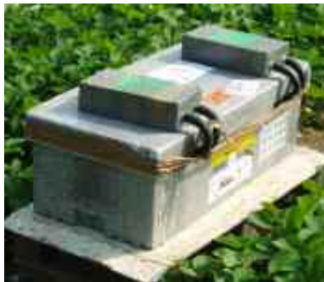
Ett humlebo med tillkopplade doseringsboxar för Binab Vector för biologisk svampbekämpning.

Mängd- och art av pollinatörer är inte den enda faktorn som bestämmer pollinerings framgång, vilket framgår av tabell 4.